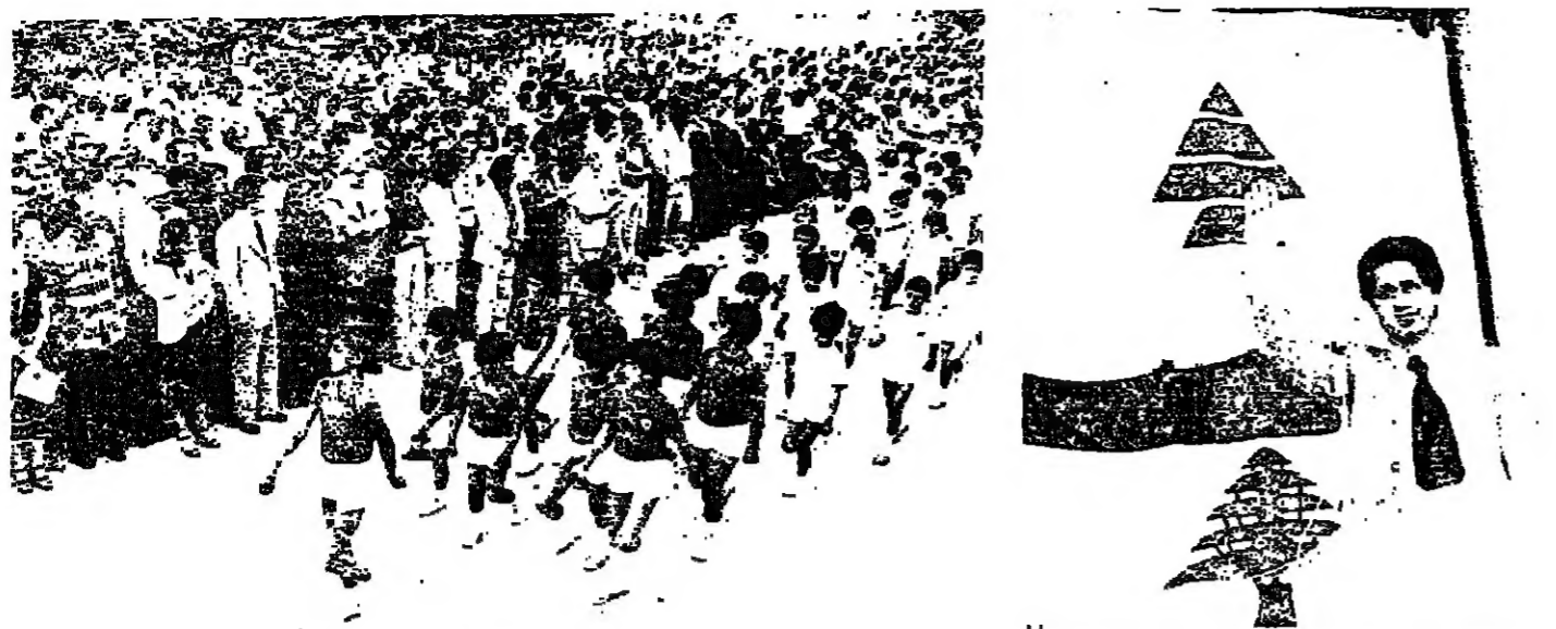
ببرون في العرض أمام الجمهور